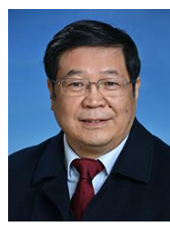
刘买利 中国科学院院士