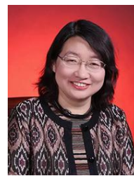
马光辉 中国科学院院士